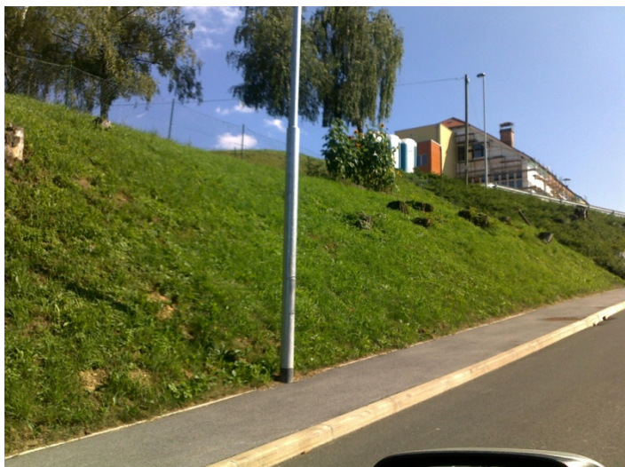
Slika 2: Pogled s severne strani na območje kotlovnice z zalogovnikom

Območje umeščanja večnamenskega objekta obsega zemljišča oz. dele zemljišč s parc. št. 187/1, 54, 188, 50/1 in 50/4, vse k.o. Krivi vrh. Velikost območja je 2520 m 2 (0,25 ha).