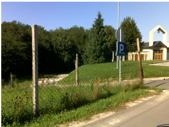
Slika 4: Pogled z zahodne strani na območje večnamenskega objekta